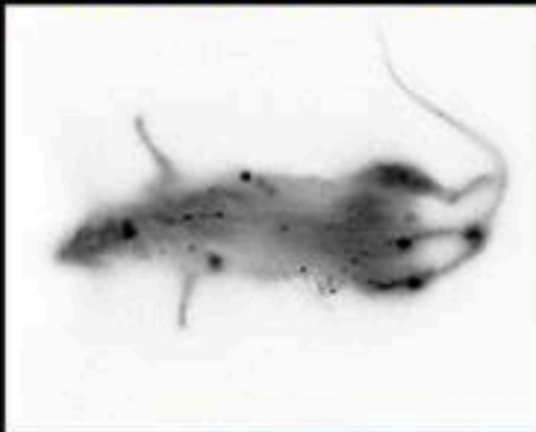
(放射線像 ノネズミ)