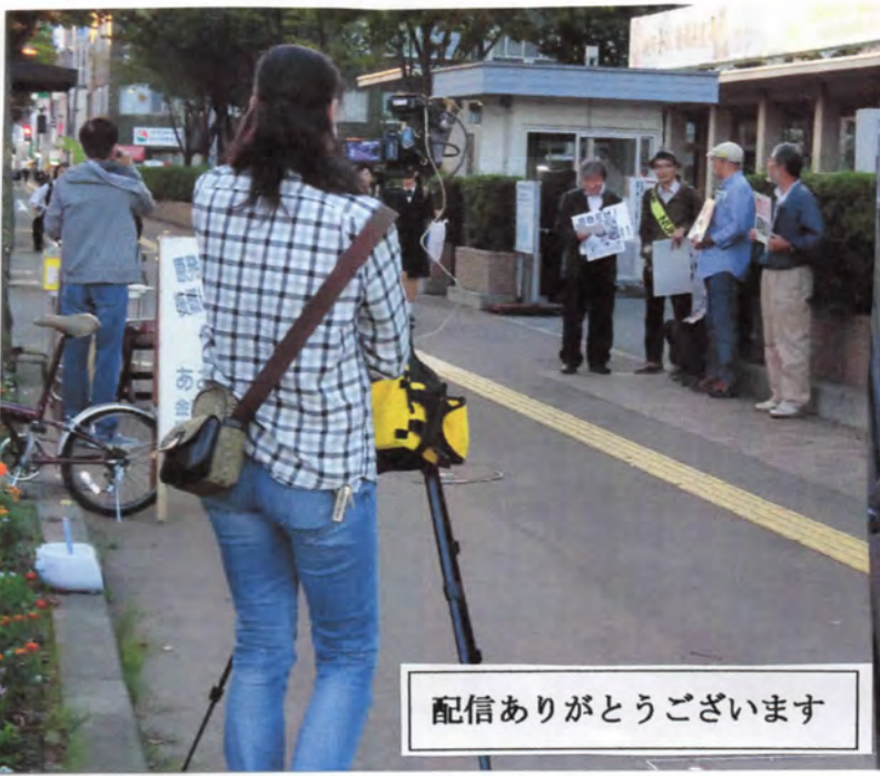
配信ありがとうございます